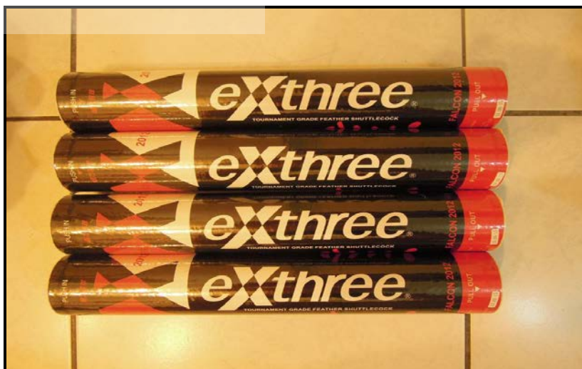
圖 3 本實驗採用 exthree 超力 2012 比賽用球

實驗用球為 exthree 超力 2012 比賽用球(如圖 3)，為避免影響實驗結果，實驗過程中若球頭有形變或羽毛有折損情形，則立即更換新球。