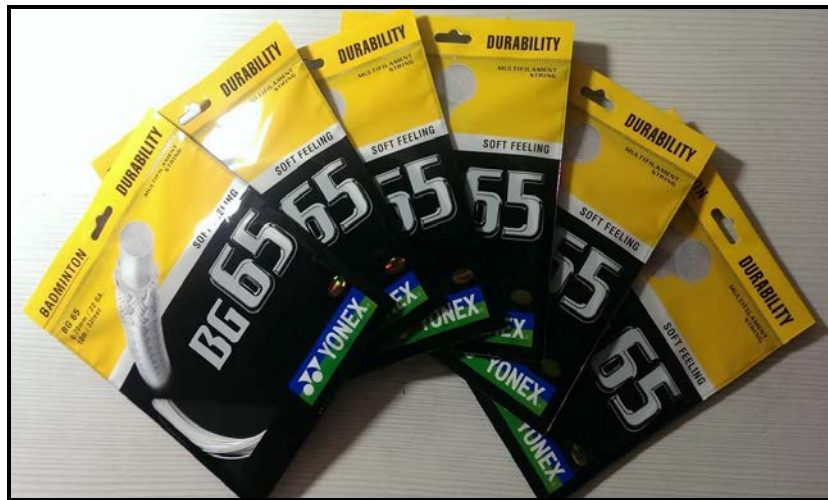
圖 2 本實驗採用之羽球線(YONEXBG-65)

本實驗採用羽球愛好者最常使用之 YONEX BG-65 羽球線(如圖 2)；穿線磅數經研究者實地訪查體育用品社專業穿線人員發現，一般社會人士男生選擇的磅數介於 22-25 磅左右，女生選擇的磅數大概介於 20-23 磅左右，因此設定本研究的穿線磅數為 23 磅，並交由專業穿線人員以同一台槓桿式穿線機穿線，以避免實驗之誤差。