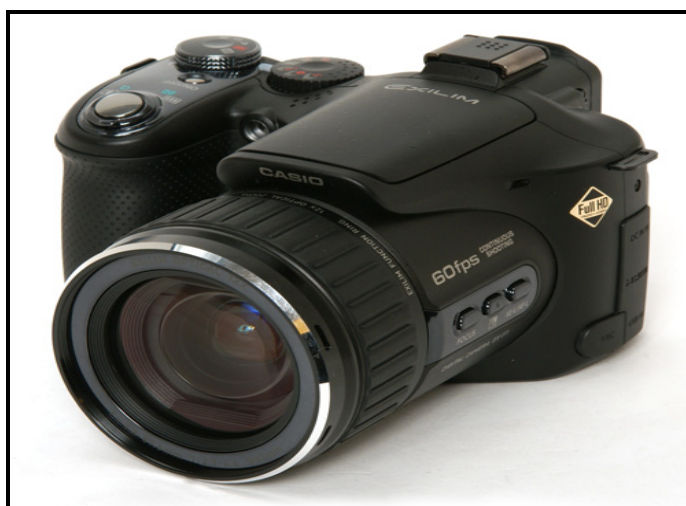
圖 4 CASIO EX-F1 高速攝影機

本研究採用 CASIO EX-F1 高速攝影機(如圖 4)，擷取頻率為 300Hz。