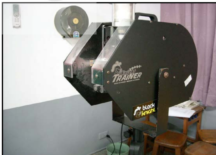
圖 5 羽球發球機